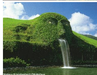
Wattens, Kristallwelten